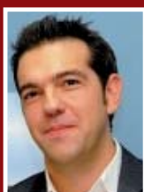
Figure emblématique de la gauche radicale grecque, et plus globalement européenne, Alexis Tsipras est à 39 ans président de SYRIA (coalition de la Gauche radicale) et Vice président du PGE. Contre les politiques d'austérité et contre l'« Europe forteresse » réfractaire à l'immigration, le candidat grec prône un changement social, culturel et écologique en profondeur.